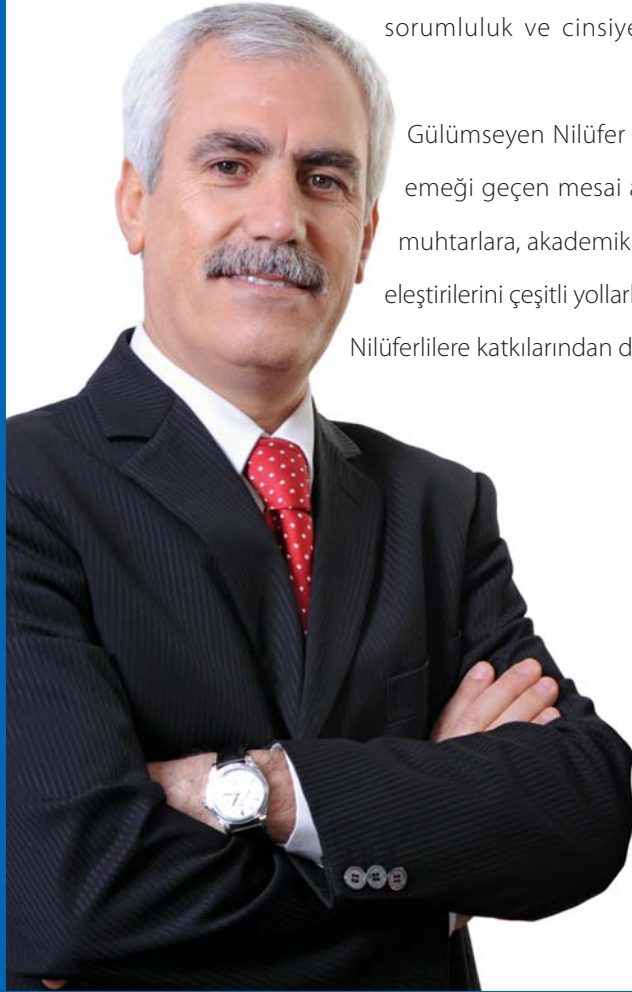
Mustafa BOZBEY Nilüfer Belediye Başkanı

Gülümseyen Nilüfer yaratma adına Performans Programının hazırlanmasında emeği geçen mesai arkadaşlarıma, sivil toplum örgütlerine, vatandaşlarımıza, muhtarlara, akademik odalara, kamu kurum ve kuruluşlarına, bize istek, öneri ve eleştirilerini çeşitli yollarla ileterek iyileştirmeye açık alanlarımızı görmemizi sağlayan Nilüferlilere katkılarından dolayı teşekkür ederim.